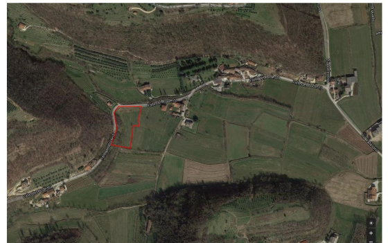
AREA AGRICOLA A VAL DI MOLINO TRA SOVIZZO E CASTELGOMBERTO