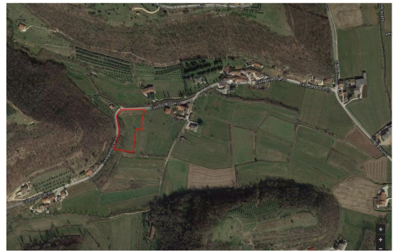
AREA AGRICOLA A VAL DI MOLINO TRA SOVIZZO E CASTELGOMBERTO